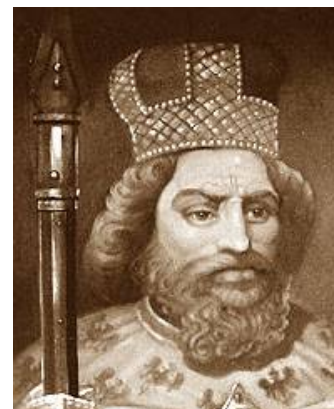
Bolko (Bolesław) II Mały (Świdnicki) (ur. pomiędzy 1309 a 1312 rokiem, zm. 28 lipca 1368)

„Książę świdnicki od 1326, jaworski od 1346, łuzycy od 1364 roku, książę na połowie Brzegu i Oławy od 1358, książę siewierski od 1359, książę na połowie Głogowa i Ścinawy od 1361 roku. Ostatni niezależny książę piastowski na Śląsk.